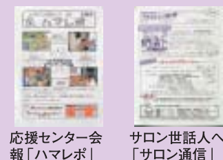
応援センター会報「ハマレポ」 サロン世話人へ「サロン通信」