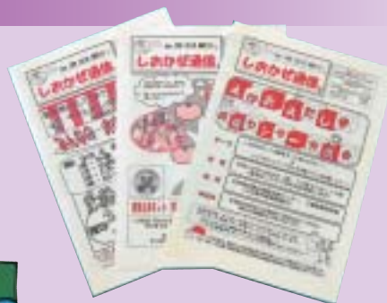
応援センター広報紙「しおかぜ通信」

応援センターではこれらの活動を広報紙「しおかぜ通信」に掲載して広く住民のみなさまへ周知しています。また、応援センター会報「ハマレポ」を登録会員さんへ、サロンに関する情報紙「サロン通信」をサロン世話人さんへ、発送しています。