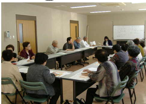
5/14 能美町サロン推進会議 (能美福祉センター)