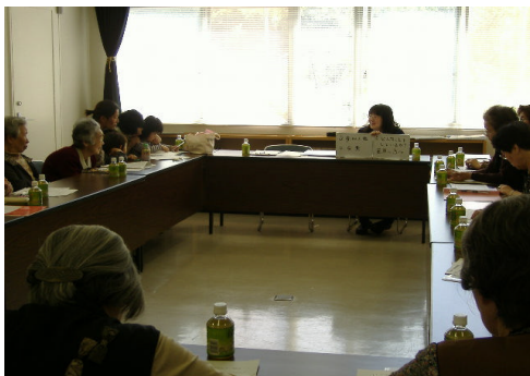
5/13 沖美町サロン推進会議 (沖美ふれあいセンター)