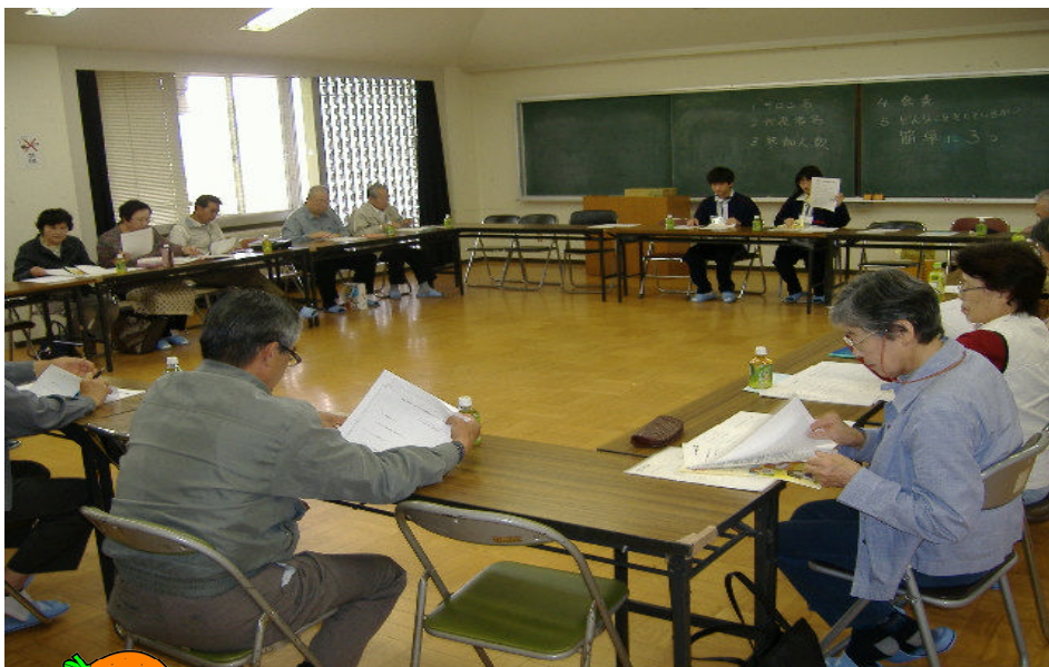
5/11 江田島町サロン推進会議 (江田島町鷺部公民館)