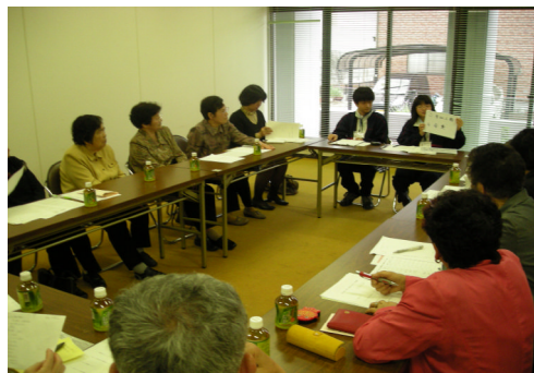
5/10 大柿町サロン推進会議 (大柿公民館)