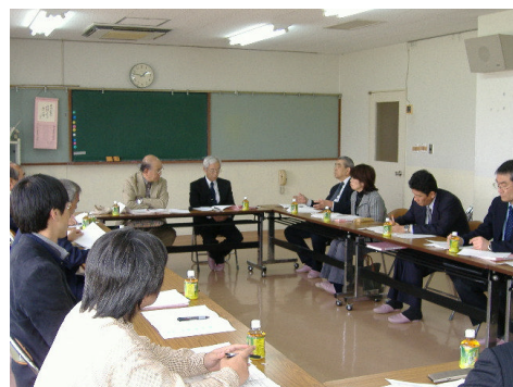
災害ボランティア活動について活発に意見が交わされました

今後も、地域一丸となって「防災・減災」について取り組み、安心・安全なまちづくりを推進していきたいと思えます。