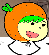
ふれあいいきいきサロン応援キャラクター カンちゃん