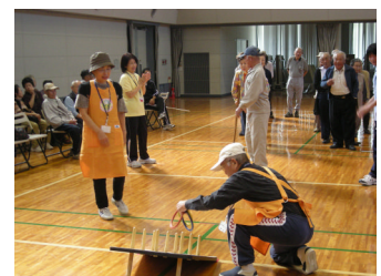
皆さんのおかげで楽しく競技できました