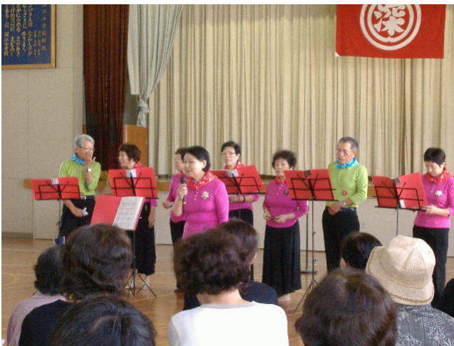
みんなが一体となったミニコンサート

「ふかえいきいきサロン」がスタートして、1年が経過。そこで、このサロンをもっと多くの方々に知ってもらいたいとの思いから、深江の自治会さんや女性会さんに協力をお願いして、地域の方々を集めてミニコンサートを開催しました。