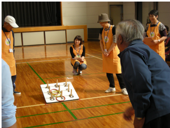
簡単なようでなかなか難しい「輪投げ」

毎年この季節に開催されるこのスポーツ大会は、常にボランティアさんが支援に関わっていて、会場の準備から、競技支援・補助、そして会場の撤収に至るまで、参加者の皆さんが楽しくスポーツ大会に参加できるよう応援してくれています。