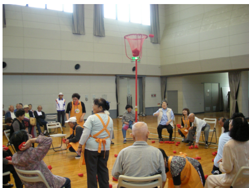
実はボランティアさんが一番大変な「玉入れ」

応援して下さったボランティアの皆さん、本当にありがとうございました。皆さんのおかげで“笑顔”いっぱいスポーツ大会になりました。