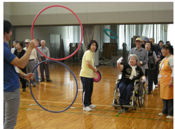
「人」から「輪」に向かって投げるように変更

参加者の皆さんは「江田島町」「能美町」「沖美町」「大柿町」の4町別に分かれて、「輪投げ」「スカイクロス」「玉入れ」の3種目で競い合います。基本的に毎年同じ競技なのですが、今年は「スカイクロス」のやり方が変更になり、これまでよりさらに安全かつ簡単に競技に参加できるようになりました。