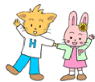
東広島市社協キャラクター ホクホクくん、ポカポカちゃん