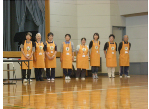
もはや欠かせない存在の『ボラさん』たちです

備から、競技支援・補助、そして会場の撤収に至るまで、参加者の皆さんが楽しくスポーツ大会に参加できるよう応援してくれています。