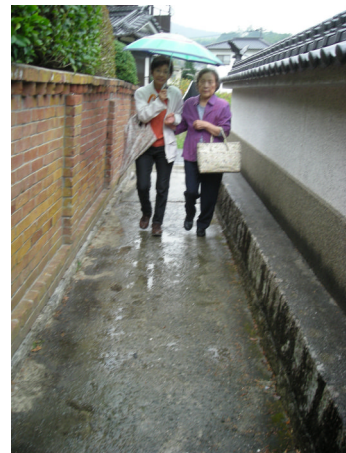
誰かが一緒だと心強いですよね

Aさんは「一緒にいてくれて良かったわぁ、また別の所に行く時はお願いできる？」と、しおかぜネットをお気に入りのご様子。早速、次の通院日に合わせて、しおかぜさんを調整中です。