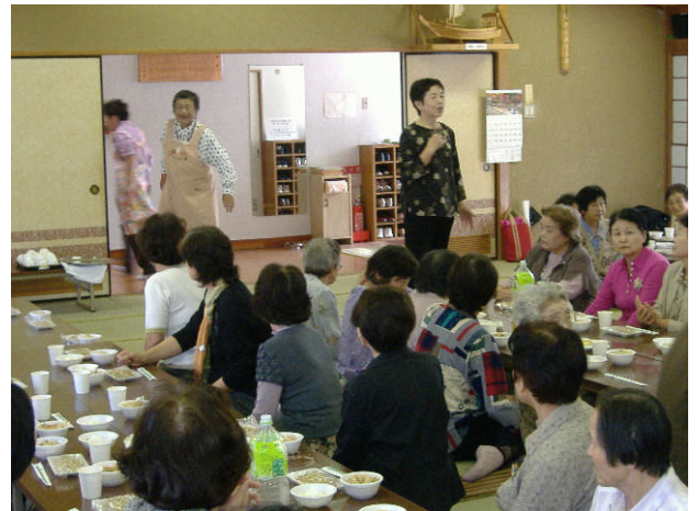
地域の中で交流の場を持つことは大切なことです