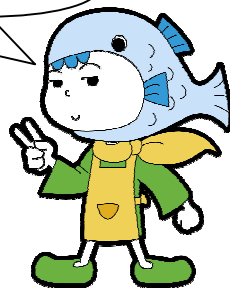
しおかぜネット応援キャラクター ハマちゃん

参加されたしおかぜさん、 東広島市社協の職員、ボランティアの皆様、 ありがとうございました!