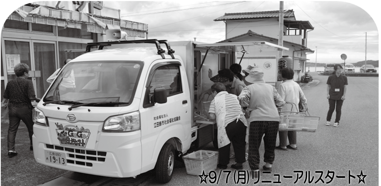
☆9/7(月)リニューアルスタート☆

9月7日(月)より、移動販売車が新車両に替わり、リニューアルスタートしました。取り扱い商品も、これまでの商品に加え『肉・魚』などの生鮮類の販売も行えるようになりました!