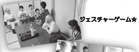
ジェスチャーゲーム★