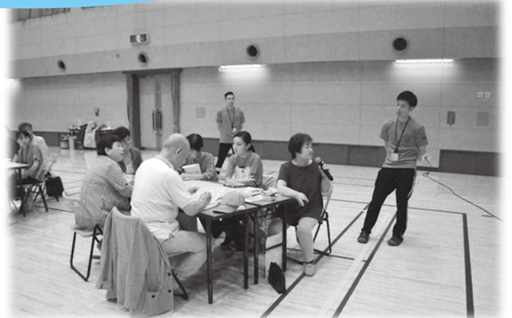
感想を話してもらいました~!!