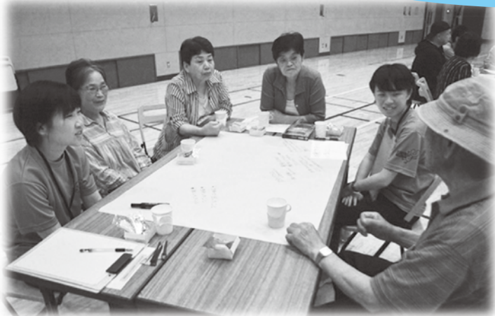
いろんな人の意見 勉強になります!