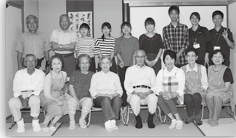
【YELL】メンバーと笑福亭メンバーで記念撮影!