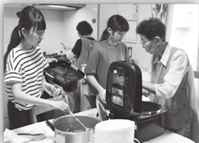
カレーとゴーヤサラダづくり