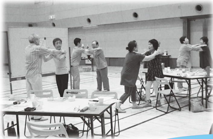
アイスブレイク 皆さん盛り上がってました~☆