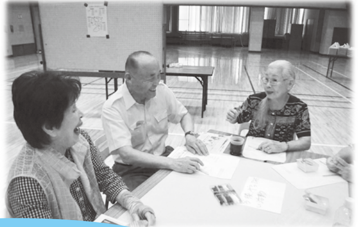
グループトーク 楽しそ~♡