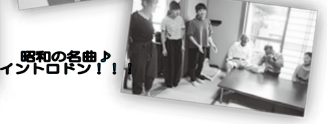
昭和の名曲♪ イントロドン!!

暑い夏も終わりに近づいた8月末、広島県立大学より、【YELL〜エール〜】が柿浦地区〜お茶の間サロン 笑福亭〜にやって来ました!【YELL〜エール〜】とは、「江田島を応援するために何か自分たちができることをしたい!!」という熱い思いを胸に、江田島でのボランティア活動を考える広島県立大学の“えたじま市応援プロジェクトのサークルメンバー”です。張り切って準備してきたものの、来島当初は緊張気味で硬い表情のYELLメンバー(一) しか〜し!心配無用!笑福亭メンバーのウェルカムな雰囲気ですぐに打ち解け、学生たちも笑顔で本領発揮!あんしんサポートリーダーさんの手作り野菜を使ったカレーライス&ゴーヤサラダづくり!笑福亭メンバーから「みんなで食べるとおいしいね☆」と言葉や笑顔が出ると、YELLのメンバーも思わず笑顔♪準備してきたゲームレクリエーションでさらに交流を深め、笑顔と活気溢れるひと時となりました(^_^)