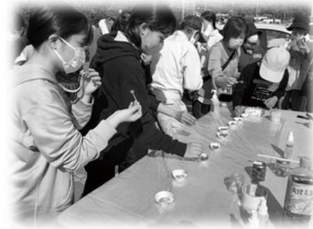
プロが作ったオリーブの塩漬けを堪能!