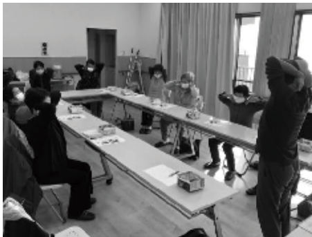
肩甲骨回しにはコツがある!?