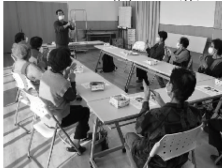
実は手のひらに健康を維持するツボがある!?