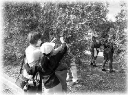
親子で協力して収穫!