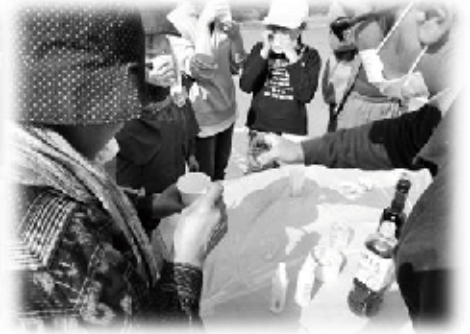
オイル・イン・味噌汁の味はいかが??