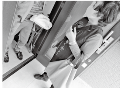
☞ 世話人が2種類の弁当を準備！出来たらレッツゴー！