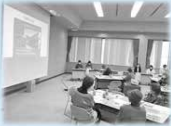
実際の“陽だまり”の様子を 大画面で見せて下さいました～♪