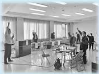
“ひろしまGENKI体操”の一コマ～☆