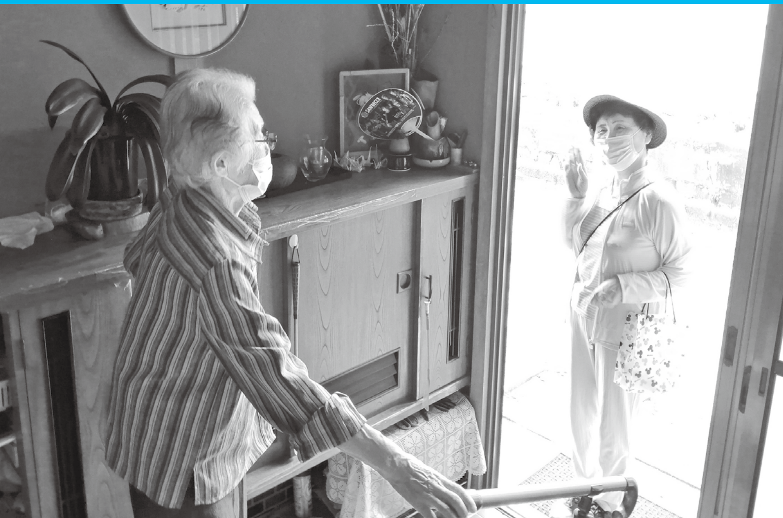
見守り支援員による見守り訪問の様子（能美町中町） ※詳しくは、P.3へGO！