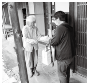
👉 新メンバーも入り、一軒一軒丁寧に声掛けをおこなっていました♡

約1年ぶりにお邪魔しましたが、毎月活動を止めることなく、感染予防対策にも配慮して進められていました。