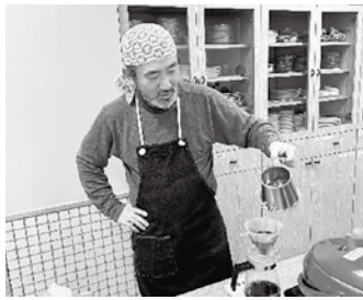
↑腰に手をあてると安定した姿勢に!