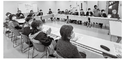
↑沢山の方に 飲んで いただきました