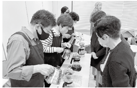
↑目の前で注目され緊張の絶頂