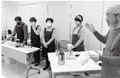
↑メンバー紹介! カフェリベルテです♡