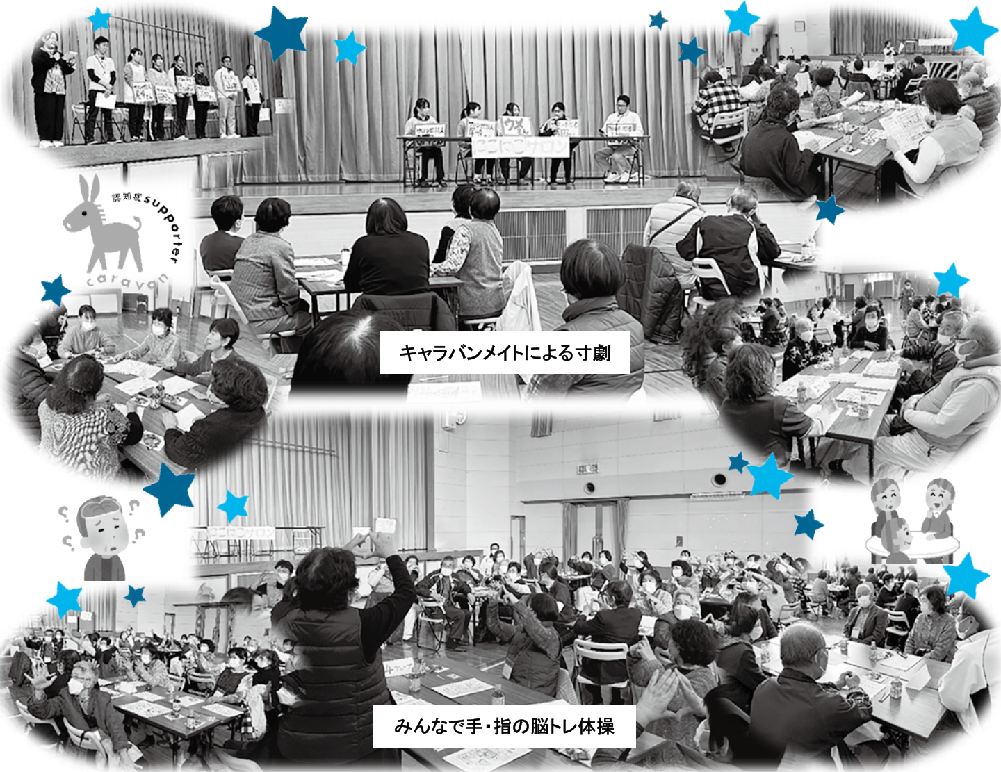
キャラバンメイトによる寸劇