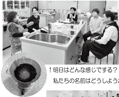
↑明日はどんな感じですか? 私たちの名前はどのようなか?