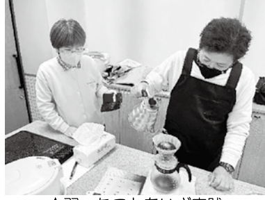
↑習ったことをいざ実践