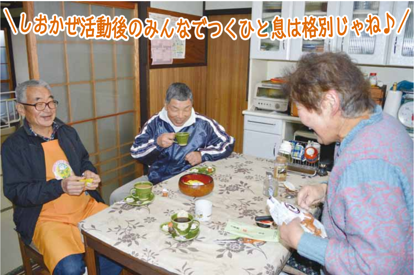
＼しおかせ活動後のみんなでつくひと息は格別じゃね♪／