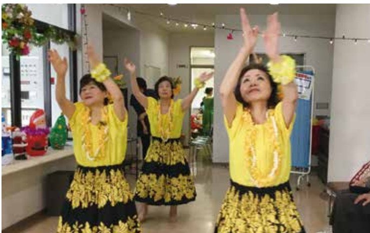
↑フラダンスを披露するボランティアさん