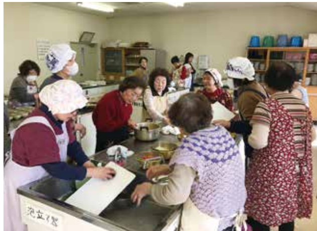
会場： 鷲部公民館 にて開催中！

和気あいあいなサロン「スカイグループ」へお邪魔させていただきました！この日は、「えたじまん食育レシピ2万食プロジェクト」のレシピをみなさんで作られていました！世話人さんのお話から、「みなさん料理が好きな方ばかりで、とても手際が良い」と言われていました。料理はとてもおいしそうにできあがっていました！お味噌汁を作る際にダシで使った昆布を、再び料理に使っていたので、私も見習わなければならないと思いました！終始笑顔に包まれたサロンでした♪