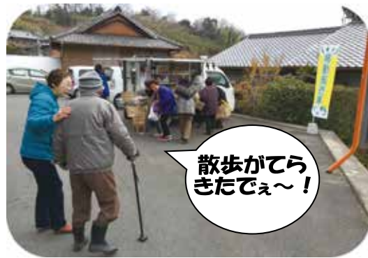
散歩がてらきたでえ〜！

平成30年2月9日（金）より、移動販売が大柿町柿浦地区において5拠点でスタートし、稼働地区は7地区28拠点となりました。以前より、買い物支援の要望も強かったこともあり、当日は56名の方が来られました。久しぶりに顔を合わせた方もいたようで、「あんた、元気にしとったん？」など、声を掛け合っていました。『買い物の充足だけでなく集える場所』にもなるよう、これからも協力していきたいと思えます！