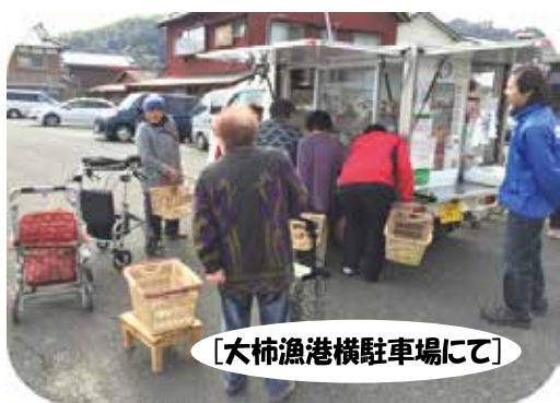
【大柿漁港横駐車場にて】