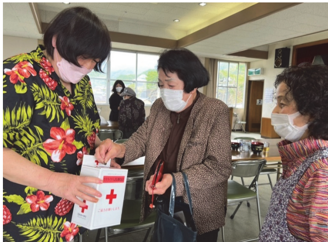
地域の催し(ふれあいサロン)での募金活動の様子