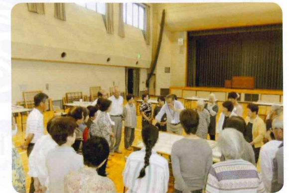
綺麗に剥がすコツなどを実演で伝授していただきました

ちなみに、この講座用に用意した貼り替え用の障子は、市内各地区にある集会所や施設から、何年も貼り替えてい