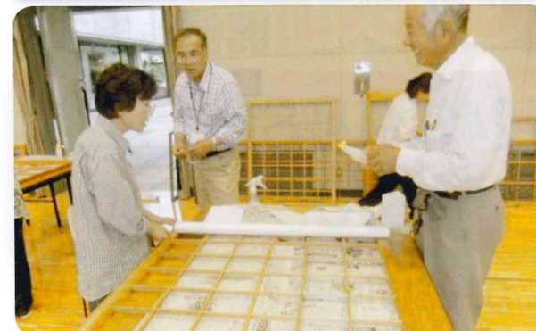
一枚目より二枚目と上達していきます。やはり「経験」が一番！

ない障子を集めたのですが、その枚数なんと70枚以上！！実習では受講者1人あたり2枚以上の障子を新しく貼り替えてもらいました。