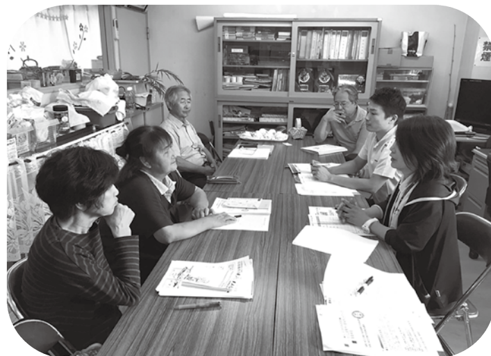
〔地域組織との訪問調整会議〕

また、新しい繋がりを作る地域の担い手として「見守り支援員」を地域の方へお願いし、「誰も行かない訪問のスキマ」に見守り支援員さんが訪問し、安否確認（声掛け）をはじめ、話し相手としても関わって、人と人の繋がりを深めています。