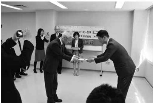
出席させて頂いた「車椅子贈呈式」の様子

「この度、社会福祉事業増進のために、株式会社 ツルハ ホールディングス様 より、車いす数台を、平成 28 年 3 月 29 日（火）に開催されました「株式会社ツルハホールディングス 車椅子贈呈式」へ出席させて頂き、「寄付頂きました。江田島市のこれからの福祉増進のために、大切に使用させて頂きます。」 本当にありがとうございました。 頂きました！