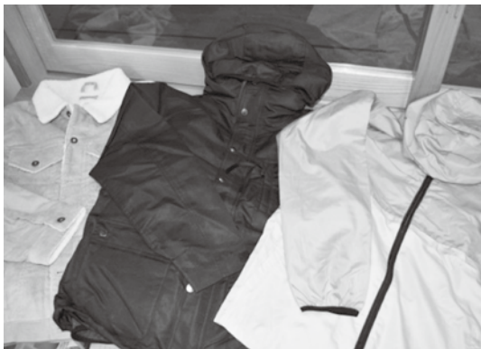
ご寄付頂いた衣類一部の写真

江田島市のこれからの福祉増進のために、大切に使用させて頂きます。本当にありがとうございます。