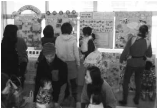
パネル展示で江田島市内の子育て情報を紹介♪