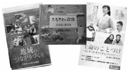
観てみたいDVDがありましたらリクエストしてください！