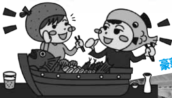
豪華海鮮料理を満喫!!