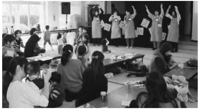
手遊び歌でみんな大盛り上がり！！

3月11日（火）鷲部公民館で『子育てフェス in えたじま』が開催され、0～80才代の方々（約170名）が集まりました！