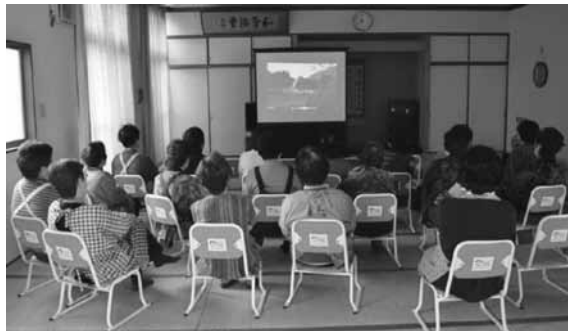
スクリーン等上映に必要な機材も貸し出します！

今、江田島市社協から3つのDVDの貸し出しと上映のお手伝いをさせていただいております。