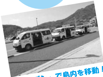
「ラフワゴン」で島内を移動!