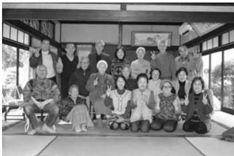
○江田島町中央「お休み処」 毎週 金 曜日 10:00～15:00