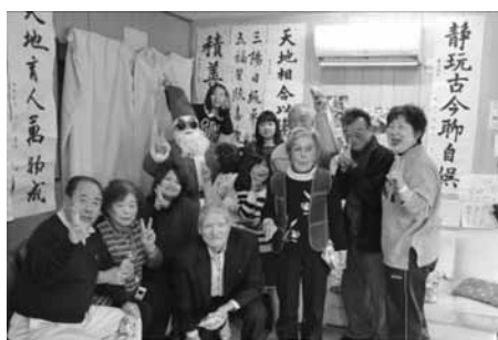
○大柿町飛渡瀬「よりんさいや」 毎週 火 曜日 10:00～15:00

あなたも、お近くの “お茶の間サロン”に お茶とおしゃべりで明るく楽 しいひと時を過ごしに行かれ てみてはいかがでしょうか？ お待ちしております♪