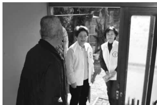
見守り支援員活動説明会終了後、見守り支援員として見守り希望者のもとへ訪問しました。 「寒くなったけど、体調は大丈夫？」「生活するのに困ったことはない？」など気かけました！！

平成25年12月より、江田島市内の5地区において、見守り支援員さんの訪問が始まりました（※平成25年12月末現在）。