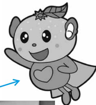
イメージキャラクター 「えたじまん」