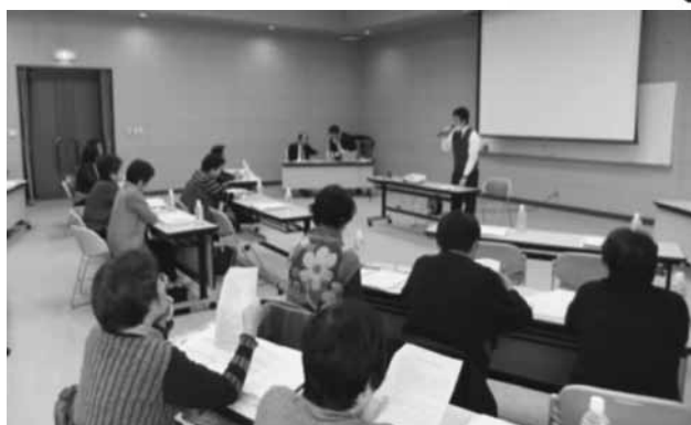
見守り支援員さんの活動前に、活動方法などの説明会を行いました！！ 江田島警察署の刑事の方にも来て頂き、緊急時の対応について学んで頂きました！！