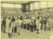
この日を楽しみにしていた多くの方が参加されました。

10月16日、江田島市身体障害者福祉協議会による「第2回スポーツ大会」が開催されました。当日は「輪投げ」「スカイクロス」「玉入れ」の3種目を、参加された約100名のみなさんと、11名のボランティアさんが楽しみながら競技をしました。