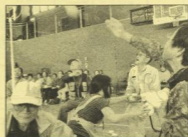
競技補助のボランティアさんも白熱！！