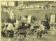
玉入れは紅白に分かれてのリーグ戦でおこなわれました

ボランティアさんも、次から次へと投げ入れられる玉拾いに大忙しで、熱く(暑く?)なりました(笑)