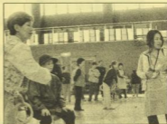
意外と美しい輪投げ。見る方も集中してしまいます。

なかでも、最も盛り上がったのは 玉入れ！！江田島・能美・沖美・大柿の各町対抗戦で行なわれ、予選、3位決定戦、決勝と熱い勝負が繰り広げられました！