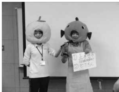
「ハマちゃん」「カンちゃん」によるアイスブレイク!