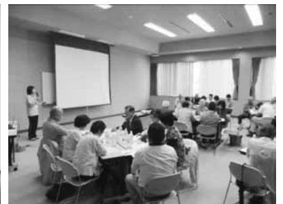
お互いの活動状況を報告しあいました