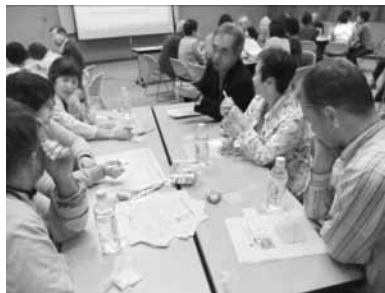
それぞれのテーブルでは、活動に関する意見が積極的に交わされました