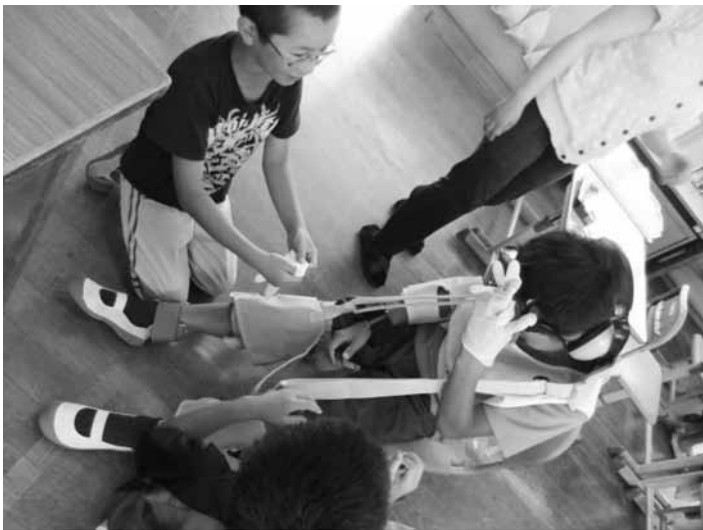
疑似体験用具の装着も難しくて一苦労！