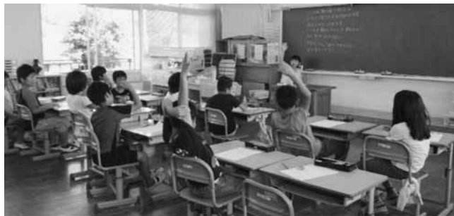
みんなで“感じた事”を共有したよ！