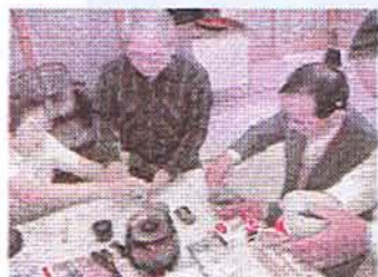
「わしのは泡が荒いのぉ…」

この日は指導者として、ご近所さんでもある茶道の先生を招いて、簡単なお茶の作法を学びました。参加人数は約20名で、皆さん楽しく和気藹々とお茶を楽しんでお互いの親睦を深めました。