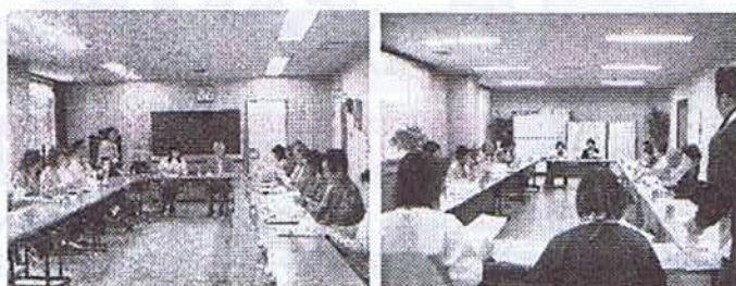
江田島会場（江田島公民館） 能美会場（能美保健センター）

これからも住民同士がふれあえる「地域のたまり場」として、皆さんが楽しく・長く・サロン活動を続けていけるよう、我々社協も応援していきたいと思っておりますのでよろしくお願い致します。