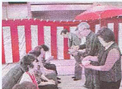
お客さんに茶碗の顔が見えるように渡します。