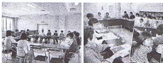
大柿会場（大柿老人保健センター） 沖美会場（ふれあいセンター）