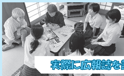
実際に広報誌を読む活動に挑戦!