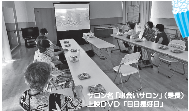
サロン名「出会いサロン」(是長) 上映DVD「日は是好日」