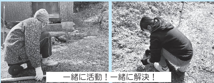
一緒に活動！一緒に解決！

せっかくしおかぜさん登録をしたにも関わらず、まだ一度も活動をしていない…という方もいらっしゃるかと思います。できる限り、色んなしおかぜさんに活動していただきたいと思っておりますので、お待ちいただけると幸いです◎