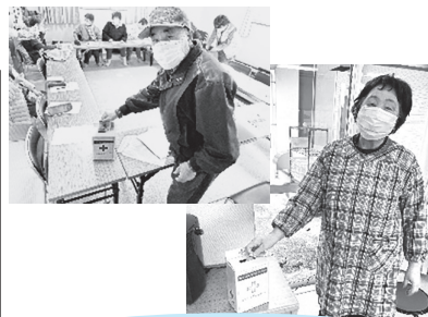
↑赤十字奉仕団の募金活動風景