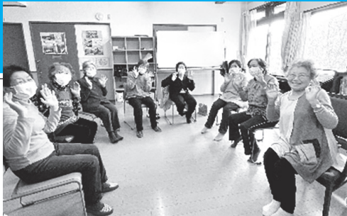
雰囲気の良いサロンです

鹿川のNPO法人「地域の絆 地域福祉センター鹿川」で、新しくふれあいサロンが立ち上がりました。 サロンが立ち上がる前は、地域住民が集まり百歳体操をしていましたが、体操後に話をする場が無いということで、 地域住民が集まって話ができる場を作りたい という想いから、立ち上げたそうです。 サロンの開催は、月末の木曜日で百歳体操後、10時～11時30分まで行われます。主には茶話会がメインで、季節ごとのイベントなどもしていけたらと言われていました。 この場所は、地域福祉センター鹿川さんが地域貢献として施設内の部屋を貸しており、“絆ベース”という自由に使える場所や“足湯”ができる場所などあります。管理者さんからは、「気軽に使ってほしい。例えば藤三で買い物した後に話をするために来るなどOK!」と言われていました。 このきずなサロンをきっかけに、地域福祉センター鹿川が、 住民同士の交流の場になり、地域のふくし拠点になればいいな と思ひます。