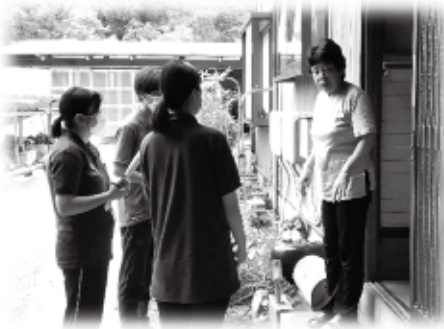
👉 地域の方にインタビュー！