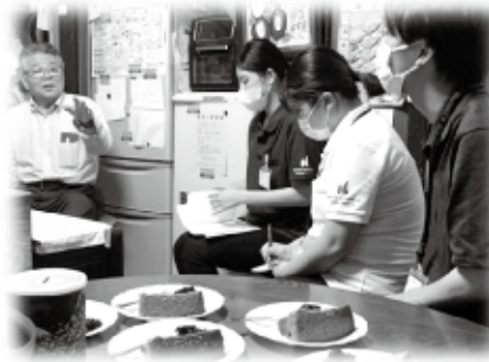
👉 地域の集いの場に参加！！