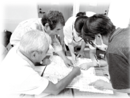
👉 地域の方々と一緒にマップ作り！