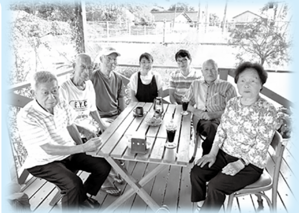
↑しゃべる会メンバーとお店の方

コーヒーを飲みながら、話をしている人達がいるという情報を聞いて、能美町鹿川にある喫茶店「セレーノ」に行ってみることに！行ってみると、5人でコーヒーを飲みながら、話をされました。詳しく話を聞いてみると、セレーノができた時からの常連さん！このメンバーはカラオケ教室の仲間で、毎日会って話をしており、お店が休みの時は、棧橋近くのコンビニに集まって話をしているということでした。お仲間の方に話を聞くと「仲間に会って話ができることは、とても楽しい！」や「元気の秘訣は、外に出て話をすること！」と言われていました。外に出て人と話をすることは、フレイル予防にもつながります。このような「気軽に集まれる場」があるのはいいですね！