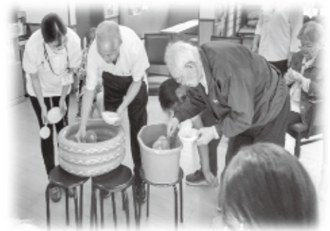
👉 一緒にレクリエーション♪