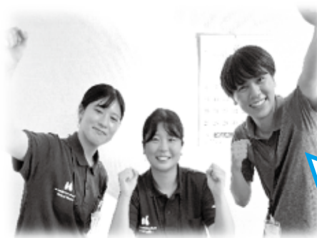
👉 今年度のキラキラ実習生☆

江田島市の住民のみなさまの温かさに触れ、この一か月間かけがえのない充実した実習となりました！！本当にありがとうございました。また、江田島に来た際は温かく迎えてくれると嬉しいです♪