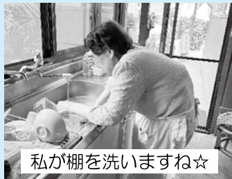
私が棚を洗いますね☆