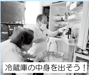
冷蔵庫の中身を出そう！