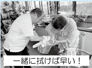
一緒に拭けば早い！