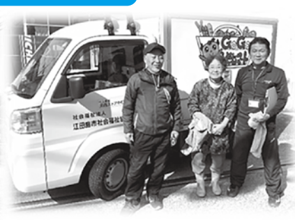
浜西ストアー中町店