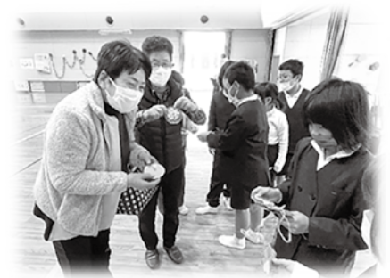
～児童たちからステキなプレゼント～