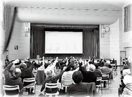
～みんなできらきら体操～