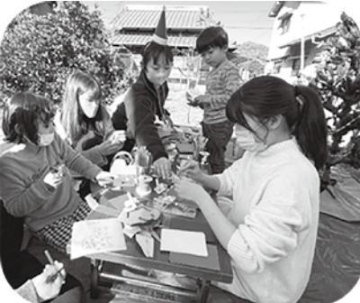
☞クリスマス会の様子。工夫を凝らして、楽しめるイベントをしていました♪