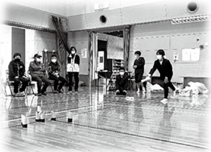
～児童たちとモルック交流～