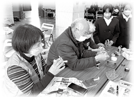
～津島織物のしおりづくり～