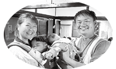
☞代表の為政ファミリーです！