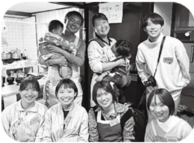
☞県立広島大学 YELL のボランティアの皆さんが、毎回運営のお手伝い☺