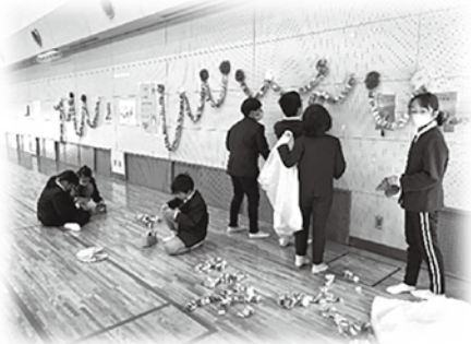
～会場準備で飾り付け中～

福祉教育を通して「 おもいやりの心 」を学び、「 地域の方を笑顔にしたい！ 」と児童たちから声上がり、交流が実現しました！これからも、 笑顔の輪が広がるような活動ができる ように取り組んでいきたいと思ます。