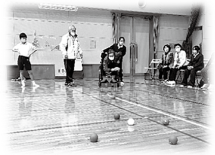
～目指せ！白い球！ポッチャ中～