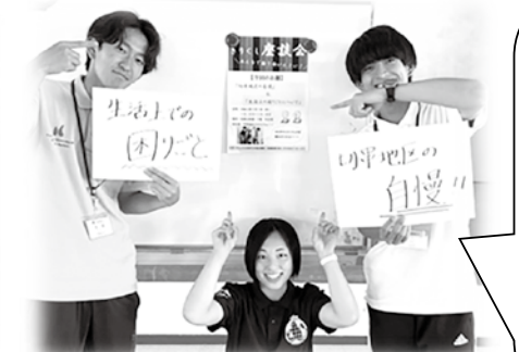
☞切串地区で座談会を企画・実行しました！