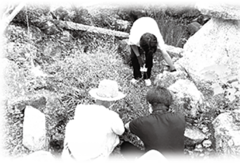
☞しおかぜネット体験で草抜き活動をお手伝い！