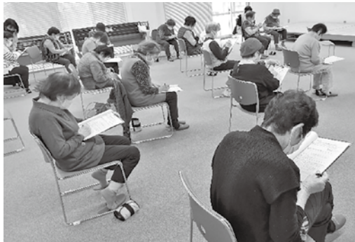
📍集いの場でおこなった調査の様子（昨年度～実施）