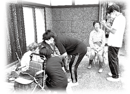
☞地域の方々にインタビュー！