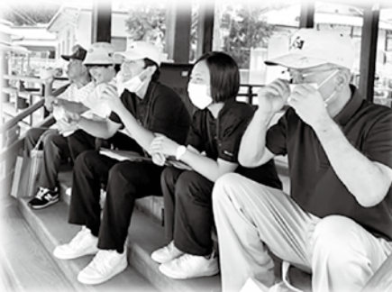
☞地域踏査！あつ〜い…。神社で休憩中♪