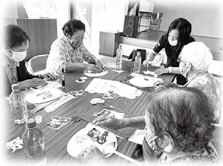
☞サロンの皆さんとうちわづくり！