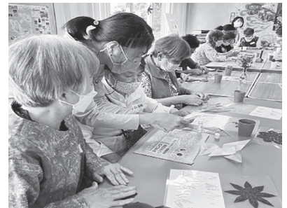
👉「笑いあいの楽しい体操🎵」の回