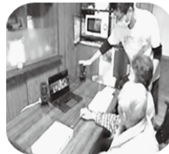
↑オンラインサロンする ところも（他市町）！