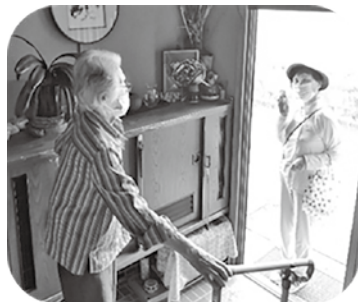
↑玄関先で安否確認！