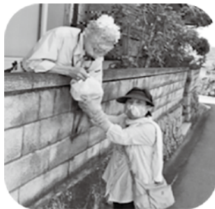
↑給食配膳活動も、自宅から外で！手作りから既製品へ！