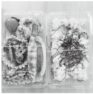
食生活改善推進員さんによる 栄養たっぷり手作りミニ丼当