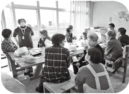
市 保健医療課 栄養士さんによる 「高齢者の虚弱と栄養」に関する講座&フリー交流