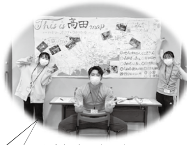
☆今年度の実習生ニコニコ三銃士☆