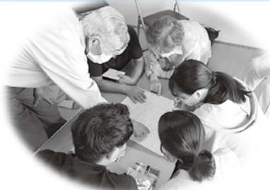
地域の方と一緒にマップ作り！