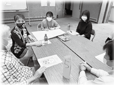
しおかせ交流会に参加！