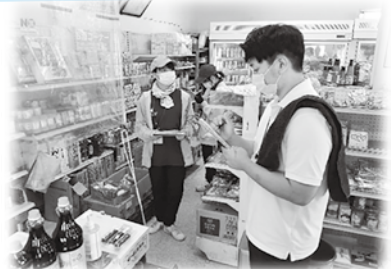
地域にあるお店の方にインタビュー！