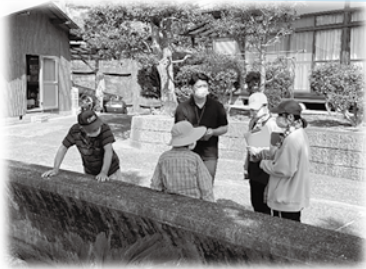
地域住民の方にインタビュー中！