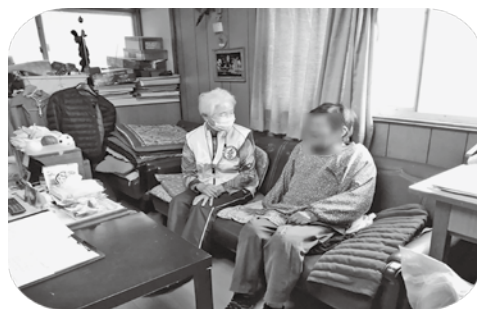
☞久々に会うとお話がちそう！

久々に会ったこともあり、話に花が咲き、あっとゆう間に時間がたってしまいました。密を避ける為にも、今は少しの時間ですが、いつか「 マスクなし 」でたっぷり話ができる日が来てほしいですねー♡