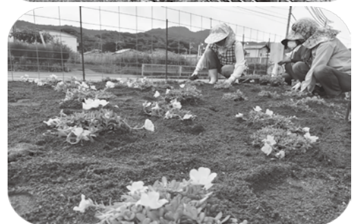
☞暑さに強い「パチュニア」を一つひとつ丁寧に植栽

中町地区の国道沿い（洗車ピカピカ村付近）に花壇がありますが、いつも「中町まちづくり協議会 環境部会の方々」が管理されています。