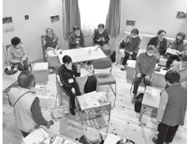
ミュージックベルで「さくら さくら」に挑戦！

4月中旬、大柿町飛渡瀬地区の「ドームサロン」に訪問させていただきました！ドームサロンは、令和2年に始動し、現在は約10名の方が参加されています。