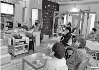
鳥や花の写真を鑑賞～📷 雄と雌の違いは意外な所に！？

新型コロナウイルス感染症による県内の感染状況を受け、5月から市内全サロンに、サロン活動の自粛をお願いしています。（5月20日現在）