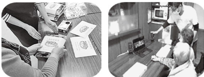
👉 配食活動も手作りから既製品へ！ 👉 オンラインサロンする所も(他市町)！