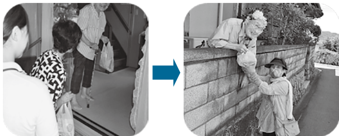
👉 見守り・声かけ方法も、変わってきました（自宅の中から外へ）！