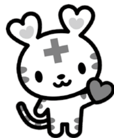
日本赤十字社マスコット キャラクター ハートちゃん