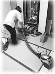
ボランティア活動