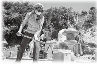
災害ボランティア活動