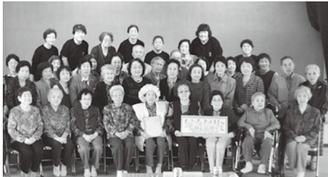
私たちが「もも組」です☆