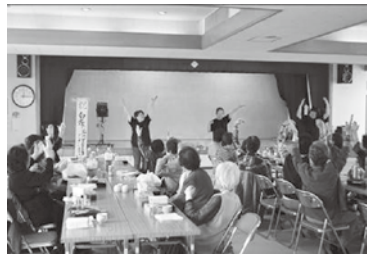
多彩なステージ演出♪