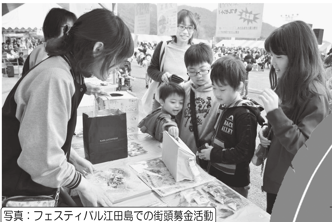
写真：フェスティバル江田島での街頭募金活動