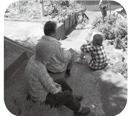
ほーっと、ひと安心！ そこから始まる井戸端会議(^_^)

皆さん、どう思われますか？ この地域では、移動販売車が週1回巡回しており、移動販売の場が一つの「繋がり の きっかけ」となっています。今回の話では意図的に「気 に かけ・声 に かけ」行うわけでもなく、むしろそう呼ぶべきものでもない、ごく自然なものだと感じました。繋がりが薄くなっている中で大切しなければならない、原点（ 地域のお宝 ）に気付かされました！！