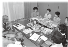
お茶菓子をつまみながら楽しくお話ししましょう♪