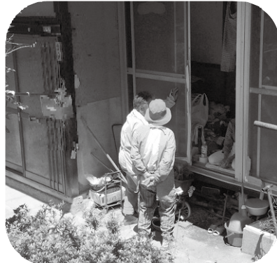
Aさんはというと... 「移動販売の日忘れ取ったわ～、ハハハッ」と！