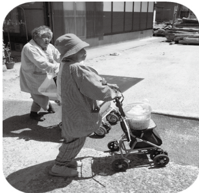
いつも一緒のAさんが顔をを出していないそう！ お二人は差し入れを持ち、Aさん宅へ！