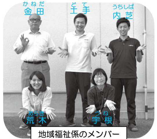
地域福祉系のメンバー