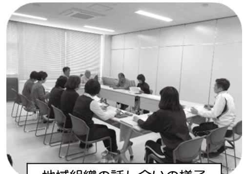
地域組織の話し合いの様子