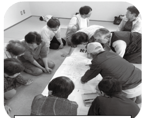
地図を用いた地域調査の様子