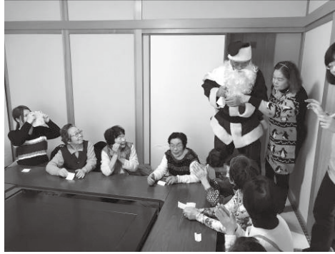
サンタさんも登場！