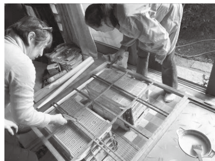
まず、のりを付けて・・・