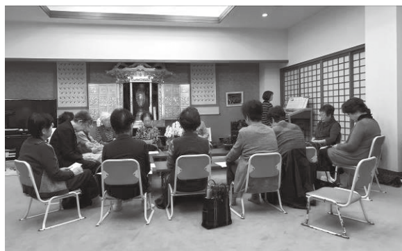
みなさん、歌を歌っています♪

★気軽に、無理なく、楽しく、自由に、過ごす! 参加者全員の笑顔で、地域に花が咲く!