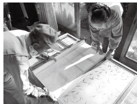
いざ! 張り替え中・・・!