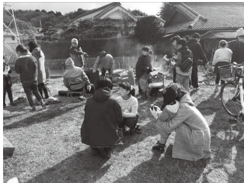
飛渡瀬「よりんさいや&てらこや」