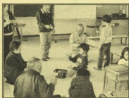
切串小学校のひとコマ