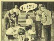
中町小学校 ひとコマ

参加された老人クラブや女性会のみなさんも、『昔あそび』から『昔話』に花が咲き、その楽しさを子どもたちに伝えることで、普段の生活では体験できない、違った角度からの知恵や知識『生きていく力』が身につけられるかもしれませんね。