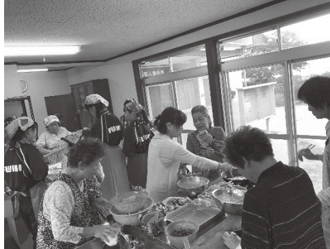
たくさんの料理ができました