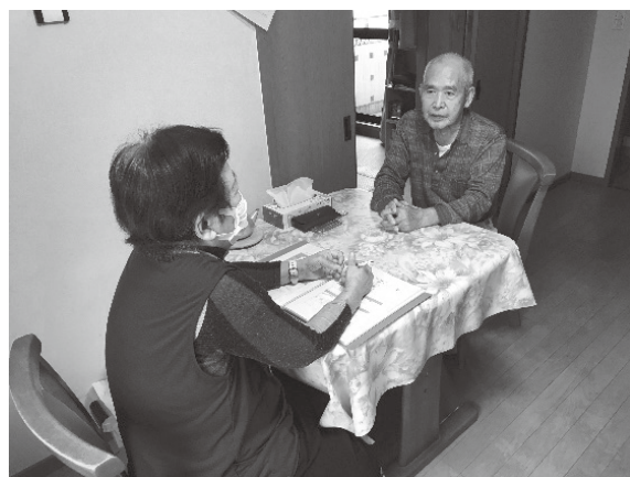
↑ 仲良くお話しされる二人

一人暮らしだと不安なことも多いですが、近所に相談や世間話をできる相手がいるのはとても安心できることですね。これからも、安心して生活できるよう、活動を応援していきたいと思います。