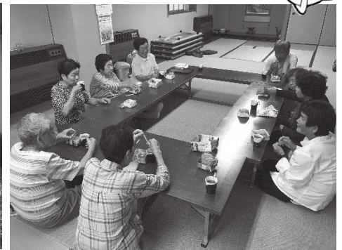
体操後のホッと一息♪