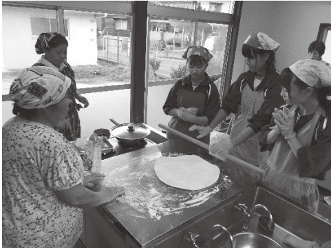
コシのある手打ちうどんを作り！