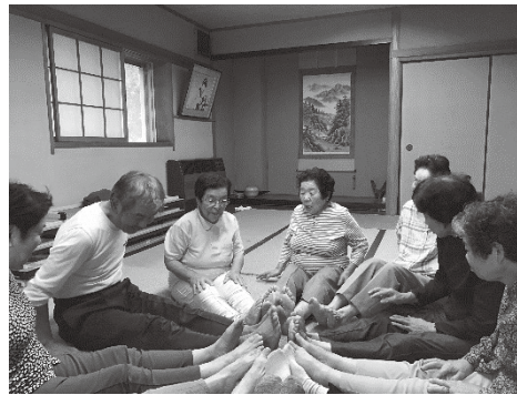
足を近づけてトントントン