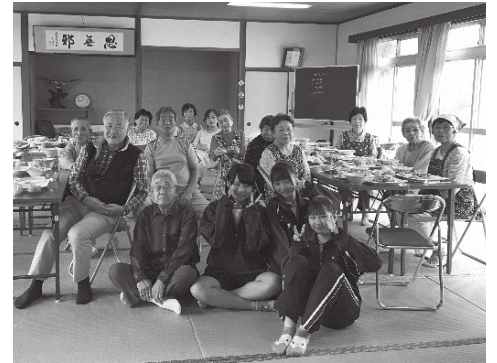
みんなで記念にパシャリ☆

宮ノ原地区のサロン「大原ふれあいサロン秋麗会」に訪問させていただきました！この日は民泊で埼玉県から来た高校生3名が来ていて、みなさんに教えてもらいながら一緒に昼食を作って食べました。手作りの手打ちうどんを切る時、太すぎたり細すぎたり、難しいと高校生たちは言っていました。参加者の方々はとても上手に切っておられ、見事なお手本でした！他にも天ぷらなどたくさんの手作り料理があり、みんなで話しながらおいしい料理を食べながら、終始穏やかな雰囲気でした♪