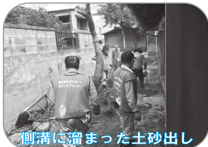
側溝に溜まった土砂出し

平成29年7月5日に降り続いた大雨により、九州北部地方に甚大な被害が出ました。その中で被災された方々の、生活復興を支える「災害ボランティア活動」。広島県域でも、ボランティアバスを起動し、福岡県朝倉市の被災地に向かいました。江田島市からも延べ6名の方が参加され、『困ったときはお互い様♥』の温かいお気持ちで、生活支援に視点をあてた土砂かきなどの、ボランティア活動を行いました！！皆さん、活動お疲れ様でした！！