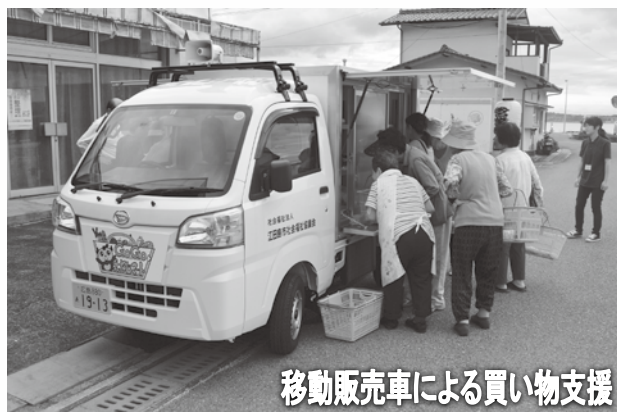
移動販売車による買い物支援