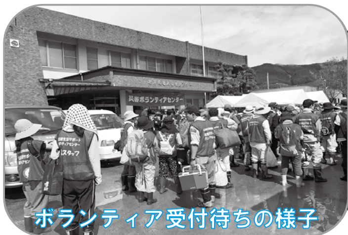
ボランティア受付待ちの様子