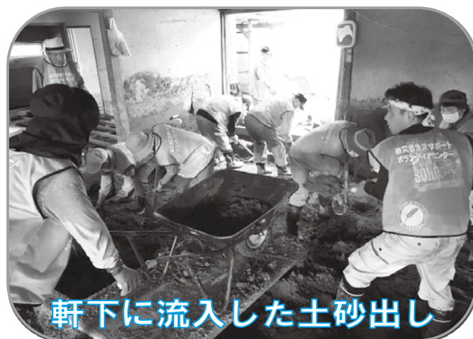
軒下に流入した土砂出し