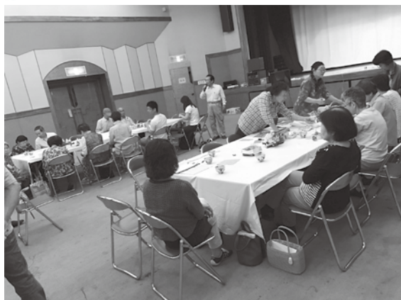
第1木曜日 10時~12時に開催しています！