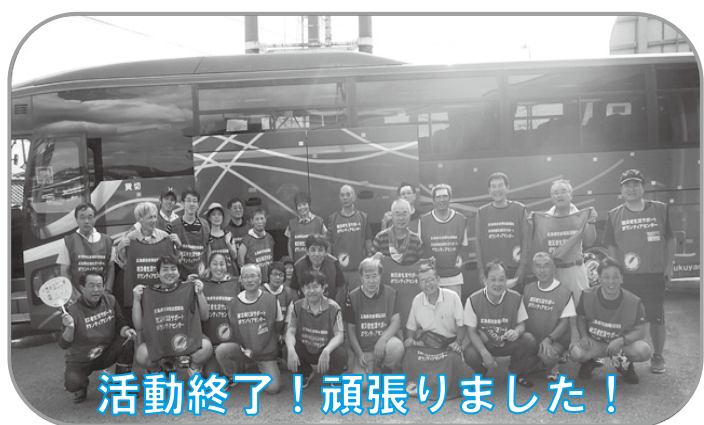
活動終了！頑張りました！