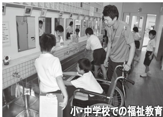
小・中学校での福祉教育