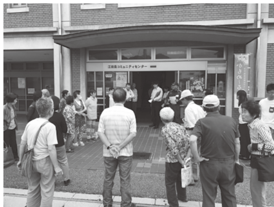
みなさん、消防訓練中！

小用地区のサロン「しあわせクラブ」に訪問させていただきました！この日は消防訓練を行っており、実際に火事が起こったことを想定して、エレベーターを使わず、お互いに助け合い、支え合いながら階段を利用して避難しておられました。サロンで災害に備えることは素晴らしいことだと思いました！